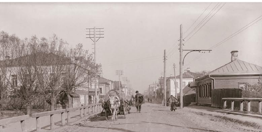
Начало Трёхсвятской улицы со стороны ст. Тверь Николаевской железной дороги.

Эта фотография старой Твери представляет большой интерес, хотя, казалось бы, на ней изображена типичная сценка городской жизни начала XX века. Во-первых, мы воочию видим, как выглядела Трёхсвятская улица в перспективе конца XIX – нач. XX вв. Во-вторых, она уникальна и нигде ранее не воспроизводилась. И в-третьих, она легко датируется.